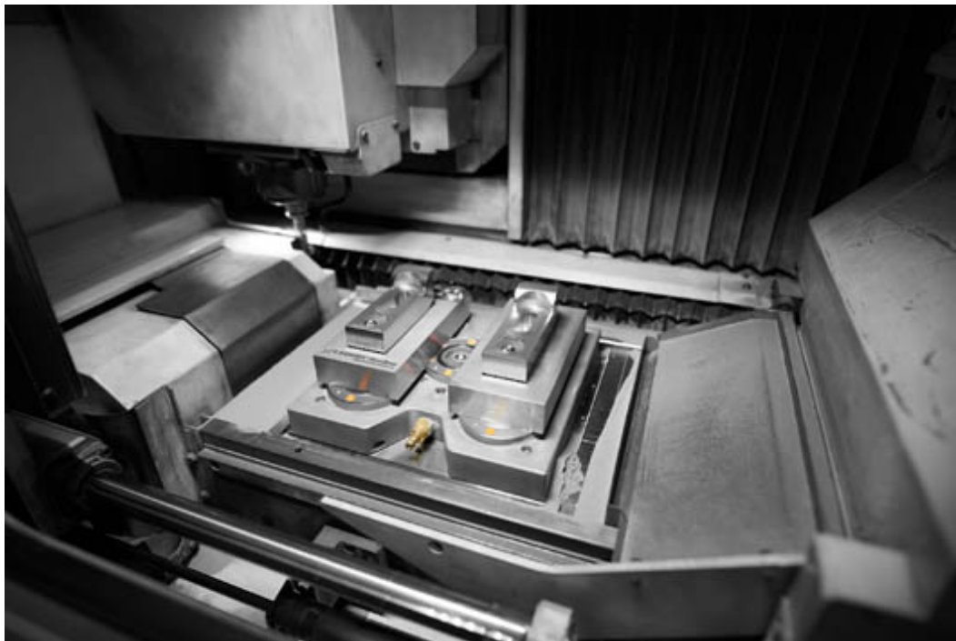
Bild Nr. 91-01 AM_MU-Spanntechnik.jpg.

Champions im Untergrund: Mit dem Nullpunktspannsystem Zero-Point von AMF lassen sich Rüstzeiten um bis zu 90 Prozent reduzieren.