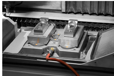
Bild Nr. 91-05 AM_MU-Spanntechnik2.jpg.

Der Fräskopf: Dessen Hochleistungsspindel beschleunigt den Fräser auf bis 45.000 U/min.